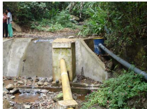
Fotografía 4. Bocatoma del acueducto de Montebello

El Decreto 1541 de 1978 estipula que el derecho al uso de las aguas se adquiere por ministerio de Ley, por concesión, por permiso o por asociación. Establece que todos los habitantes tienen derecho de usar las aguas de dominio público, mientras discurren por los cauces naturales, para beber, bañarse, abreviar animales, lavar ropas, mientras no se violen disposiciones legales o derechos de terceros. Este uso debe hacerse sin establecer derivaciones, emplear máquinas o aparatos, detener o desviar el curso de las aguas, alterar o contaminar las aguas imposibilitando su uso por parte de terceros.