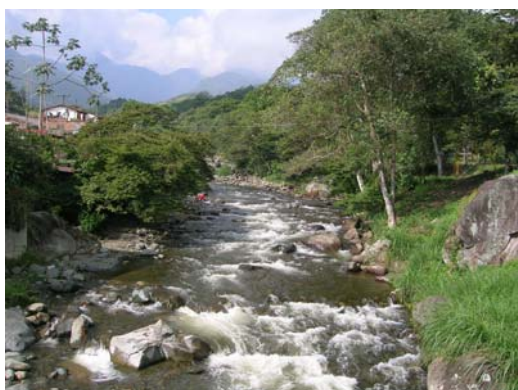
Fotografía 2. Río Pance

La Ley 373 de 1997 sobre Uso Eficiente del Agua, estipula que en el estudio de fuentes de abastecimiento, en cualquier proyecto que pretenda hacer uso del agua, es necesario incluir la oferta de aguas lluvias, mientras sea técnica y económicamente viable. No obstante, el RAS 2000 señala en cuanto al abastecimiento por aguas lluvias, que únicamente debe usarse cuando no exista otra fuente, y que para su utilización, se debe asegurar una dotación mínima, de acuerdo con el nivel de complejidad del sistema. Esto implica que las aguas lluvias no podrían considerarse como una opción complementaria para alcanzar la dotación demandada.