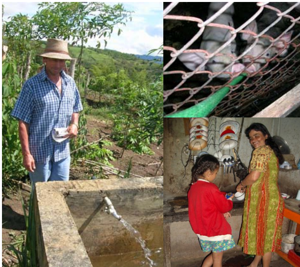
Fotografía 1. Agua para las actividades domésticas y productivas