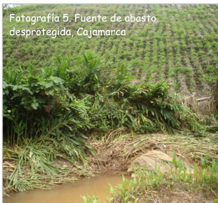
Fotografía 5. Fuente de abasto desprotegida, Cajamarca