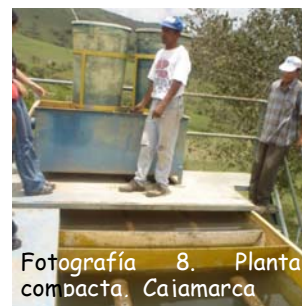
Fotografía 8. Planta compacta. Caiamarca

El Decreto 475 de 1998 también contiene los parámetros que los prestadores del servicio de acueducto deben medir y la frecuencia con que deben hacerlo. Para poblaciones hasta de 12500 habitantes se exige realizar cada 4 días muestras de pH, color, olor, sustancias flotantes, turbiedad, nitritos, cloruros, sulfatos, hierro total, dureza total y cloro residual libre, cuando este se utilice como desinfectante. Los análisis microbiológicos para poblaciones hasta de 12900 habitantes deben realizarse cada 3 días.