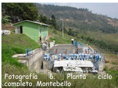
Fotografía 6. Planta ciclo completo. Montebello

El Decreto 475 de 1998 expide normas técnicas de calidad del "agua potable". Señala que el agua suministrada por las Empresas de Servicios Públicos (ESPs), debe ser apta para consumo humano, independientemente de las características del agua cruda y su procedencia. En este mismo Decreto se plantea la posibilidad de suministrar agua segura, cuyos criterios de calidad para parámetros organolépticos, fisicoquímicos y microbiológicos son menos restrictivos, comparados con los del agua potable. Sin embargo, resalta que esto, únicamente puede hacerse en la eventualidad de un desastre o emergencia, que afecte el normal suministro de agua potable a la población.