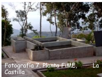
Fotografía 7. Planta FiME, La Castilla