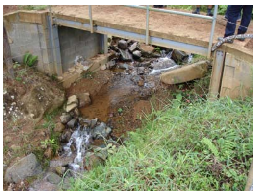
Fotografía 3. Quebrada El Chocho

En materia de reuso de aguas residuales, generadas por cualquier tipo de actividad que produzca efluentes líquidos, la misma Ley 373 de 1997 indica que éstas deberán ser reutilizadas, cuando haya viabilidad técnica, ambiental y económica, y se cumplan las normas de calidad ambiental. En esta Ley se delegó al Ministerio de Ambiente, Vivienda y Desarrollo